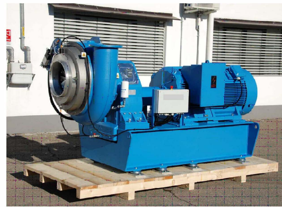
Compressore con basamento e motore 315 kW

N.B. In rosso sono indicati gli interventi di progetto